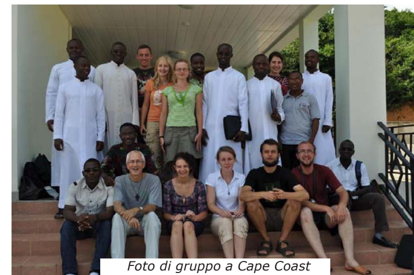
Foto di gruppo a Cape Coast