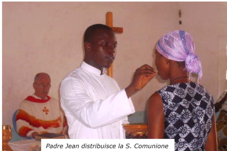
Padre Jean distribuisce la S. Comunione

Un giorno mi capitò in mano una newsletter che promuoveva la vocazione comboniana: ricordo ancora il sentimento che mi lasciò quella lettura e una piccola scritta che porto ancora stampata in mente: "questo cammino può essere il tuo!". In seguito ho letto molti altri numeri della stessa newsletter, ma non ho più provato nulla di simile. Parlando di questo mio sentimento col mio parroco, questi mi ha detto di pregarci su. Solo dopo molte insistenze mi ha concesso di scrivere ai comboniani che mi han fatto partecipare a campi vocazionali. Nel 2000, dopo il liceo ho insegnato un anno in una scuola cattolica gestita da una missione comboniana dove ho potuto vedere e vivere il carisma dell'istituto. Nel 2002 sono stato ammesso come postulante a Lome' (Togo) e quindi al noviziato a Cotonou