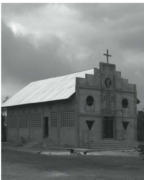
La chiesa di Abor in costruzione (2002)

problemi all'ordine del giorno. Tra le varie idee pian piano abbiamo cominciato a trovare una direzione in cui incanalare il nostro lavoro sia in Italia che verso il Ghana. Già, le relazioni verso il Ghana: quante discussioni e quante energie spese su questo argomento! Ognuno che tornava da un periodo ad Abor aveva la sua idea, generalmente diametralmente opposta a quella di chi lo aveva preceduto, in più la distanza culturale e la fallacia dei mezzi di comunicazione si facevano sentire ed è stato solo col tempo e con molta pazienza che siamo riusciti a trovare un qualche equilibrio, seppur ballerino, scoprendo un modo in cui ognuna delle due parti, in Italia e in Ghana, potesse portare il suo contributo costruttivo per la comune opera che si stava