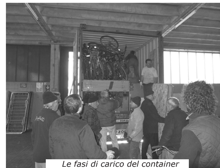
Le fasi di carico del container

ad un lavoro minuzioso e certosino alla fine tutto ha trovato un posto: dal ferro per costruzione ai letti ortopedici per ospedale, dal materiale sanitario alle macchine per falegnameria, da un motociclo "Ape" con cassone a più di 100