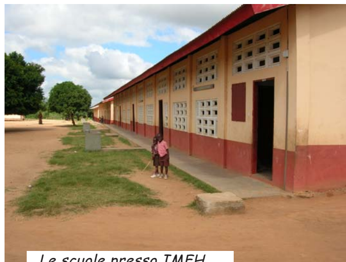
Le scuole presso IMFH

spioventi. Questa erosione è ovviamente dannosa in quanto, oltre a rendere più difficile l'accesso alle strutture, rischia di compromettere la solidità degli edifici. Dal punto di vista tecnologico si è scelto di allestire delle vasche di semplice