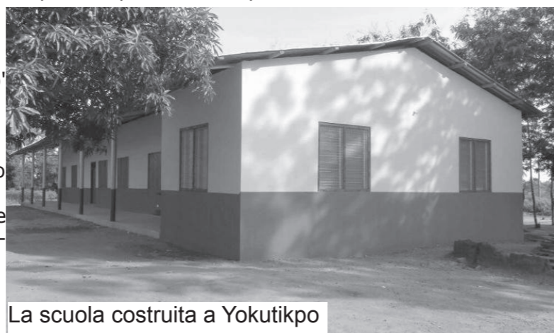
La scuola costruita a Yokutikpo

Alla domenica riusciamo a fare un giro in pulmino preso in affitto: la prima domenica andiamo a visitare la diga di Akosombo, la seconda scegliamo di fare il bagno all'oceano con i bambini di Abor. In un baleno le due settimane passano ed è ora di verificare