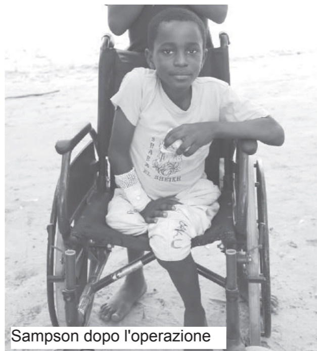
Sampson dopo l'operazione

Registrazione presso la Cancelleria del TRIBUNALE DI LECCO n. 0540/03 del 14 maggio 2003