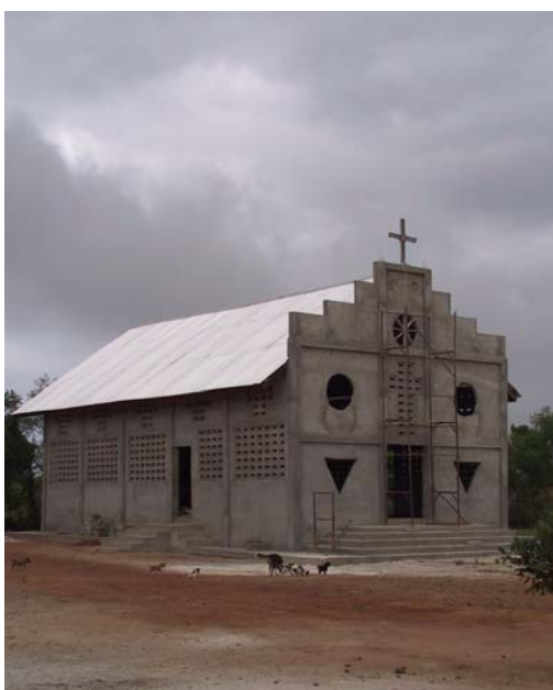
La chiesa di Abor in costruzione (2002)

problemi all'ordine del giorno. Tra le varie idee pian piano abbiamo cominciato a trovare una direzione in cui incanalare il nostro lavoro sia in Italia che verso il Ghana. Già, le relazioni verso il Ghana: quante discussioni e quante energie spese su questo argomento! Ognuno che tornava da un periodo ad Abor aveva la sua idea, generalmente diametralmente opposta a quella di chi lo aveva preceduto, in più la distanza culturale e la fallacia dei mezzi di comunicazione si facevano sentire ed è stato solo col tempo e con molta pazienza che siamo riusciti a trovare un qualche equilibrio, seppur ballerino, scoprendo un modo in cui ognuna delle due parti, in Italia e in Ghana, potesse portare il suo contributo costruttivo per la comune opera che si stava