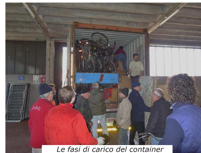
Le fasi di carico del container

ad un lavoro minuzioso e certosino alla fine tutto ha trovato un posto: dal ferro per costruzione ai letti ortopedici per ospedale, dal materiale sanitario alle macchine per falegnameria, da un motociclo "Ape" con cassone a più di 100