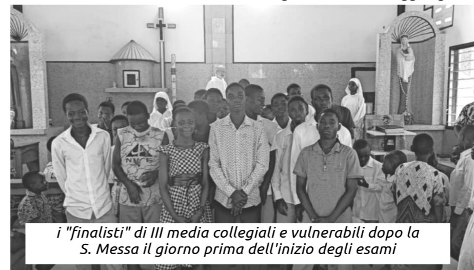
i "finalisti" di III media collegiali e vulnerabili dopo la S. Messa il giorno prima dell'inizio degli esami

"Poste Italiane S.p.A. - Spedizione in abbonamento Postale - D.L. 353/2003 (conv.in L. 27/02/2004 n° 46) art. 1 comma 2 - DCB Lecco"