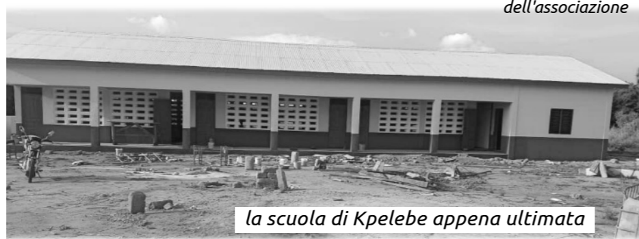
la scuola di Kpelebe appena ultimata